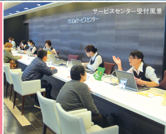
サービスセンター受付風景 けいじゅサービスセンター